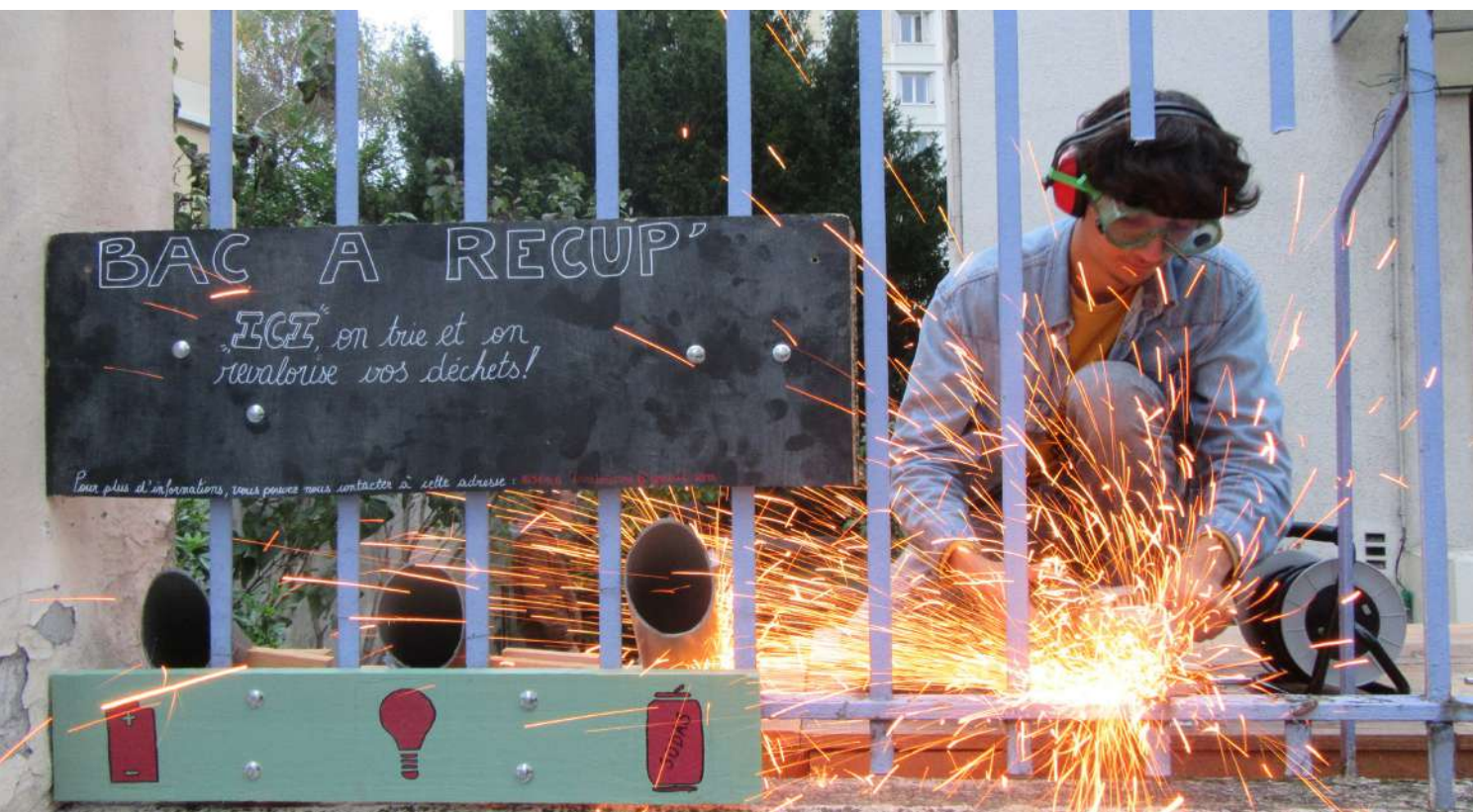
Construction de récupérateurs ouverts sur la rue pour une revalorisation des déchets - CHRS PolyGônes ; p.10.