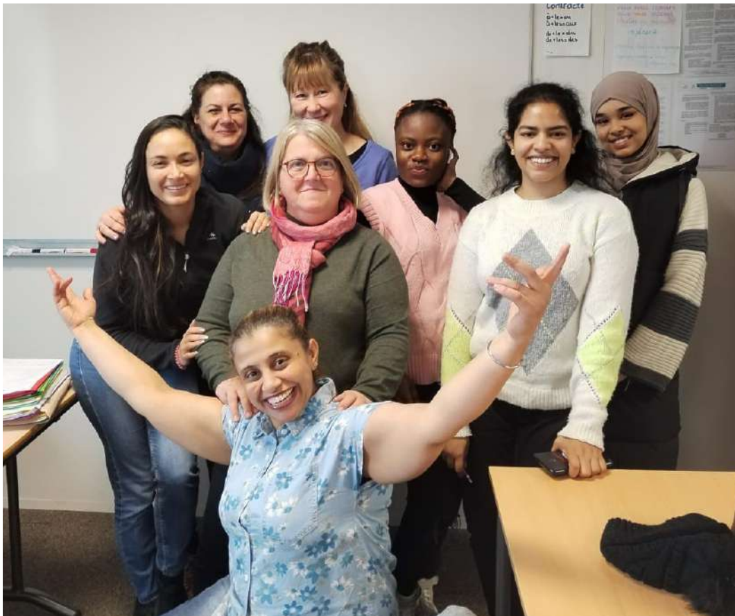
Groupe de stagiaires FLE avec leur formatrice sur le site de Villeurbanne