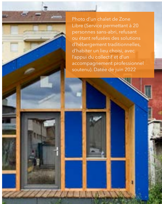
Photo d'un chalet de Zone Libre (Service permettant à 20 personnes sans-abri, refusant ou étant refusées des solutions d'hébergement traditionnelles, d'habiter un lieu choisi, avec l'appui du collectif et d'un accompagnement professionnel soutenu). Datée de juin 2022

À l'heure de la réforme de la tarification des CHRS, la prise en compte de ces problématiques dans les financements est incontournable.