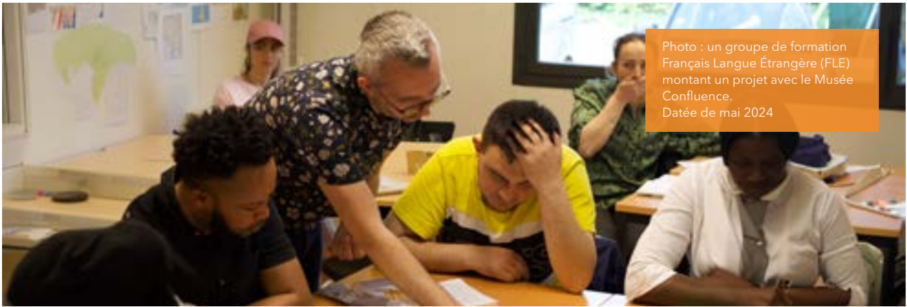
Photo : un groupe de formation Français Langue Étrangère (FLE) montant un projet avec le Musée Confluence. Datée de mai 2024