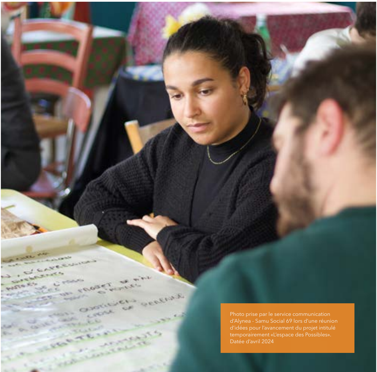
Photo prise par le service communication d'Alynea - Samu Social 69 lors d'une réunion d'idées pour l'avancement du projet intitulé temporairement «L'espace des Possibles». Datée d'avril 2024