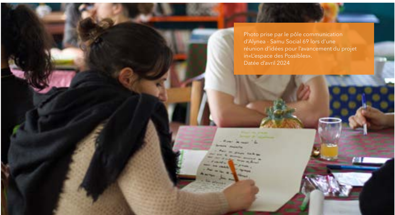
Photo prise par le pôle communication d'Alynea - Samu Social 69 lors d'une réunion d'idées pour l'avancement du projet in «L'espace des Possibles». Datée d'avril 2024

La pérennisation de ce format d'échange comme outil de partage des savoirs fait partie intégrante de la mise en oeuvre de ce projet.